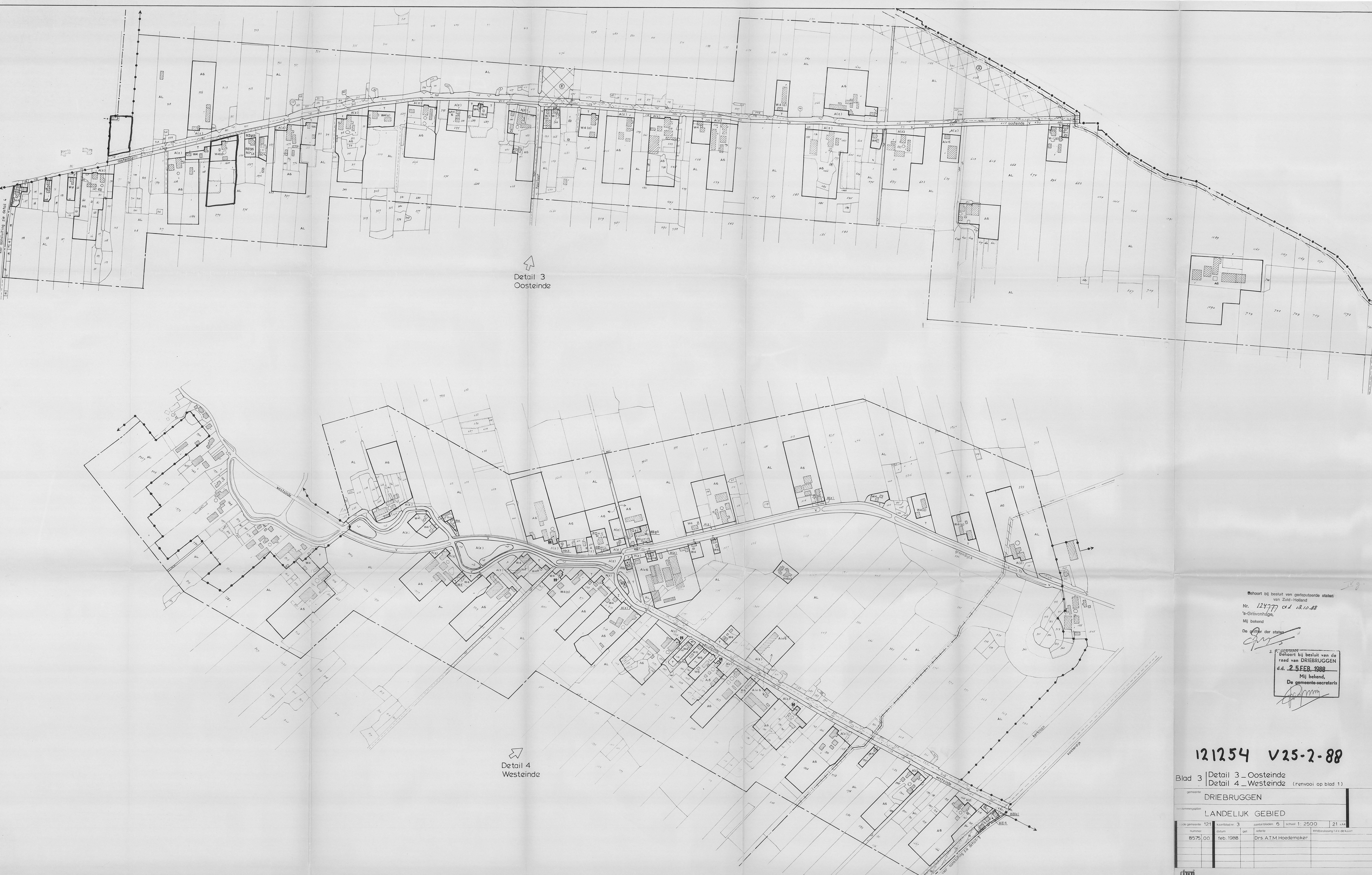
Detail 3 Oosteinde