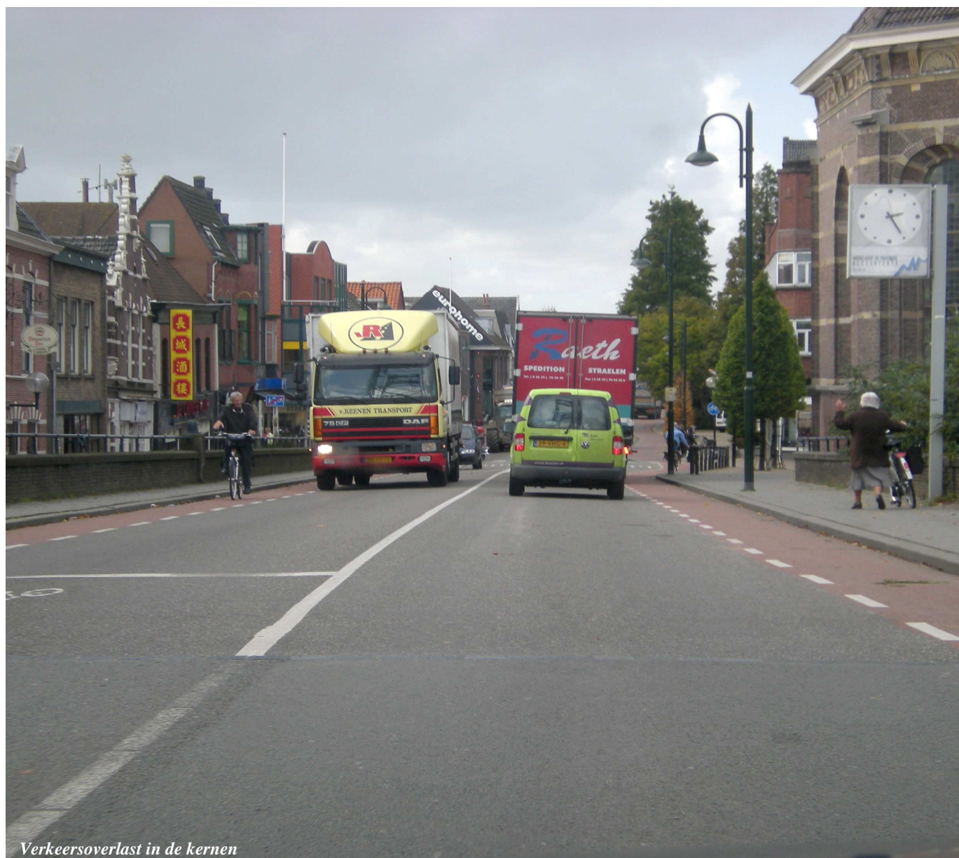
Verkeersoverlast in de kernen

EEN STERKE ECONOMISCHE ACTIVITEIT ALS DIE VAN DE GREENPORT MOET GOED PASSEN IN DE OMGEVING. DE NAGESTREEFDE BELEEFBAARHEID, ZOALS IN HET VORIGE HOOFDSTUK BESCHREVEN, DRAAGT OP ZICHZELF AL BIJ AAN DE KWALITEIT VAN DE OMGEVING. VAN DE INFRASTRUCTUURVERBETERING DIE NODIG IS VOOR EEN GOED FUNCTIONERENDE GREENPORT, ZAL OOK DE LEEFBAARHEID IN DE OMGEVING PROFITEREN. DE ONTWIKKELING VAN DE GREENPORT KAN DAARNAAST EEN POSITIEVE INVLOED HEBBEN OP DE WOONFUNCTIE IN DE KERNEN.