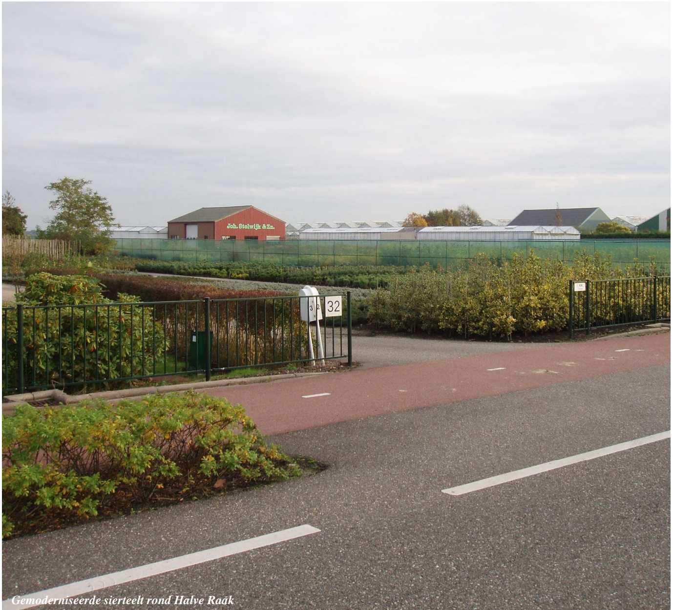
Gemoderniseerde siereteelt rond Halve Raak

Daarmee staat de Greenport regio Boskoop voor een grote en complexe opgave, waarin de overheid een belangrijke taak te vervullen heeft. De ontwikkeling van de centrumfunctie en de kwaliteiten van de Greenport moeten naar de overtuiging van de gemeenten met enthousiasme worden aangepakt. Alleen zo kan de achterstand worden ingelopen en omgezet in een voorsprong. Dat hoeft zeker niet in strijd te zijn met de doelen voor landschap en leefbaarheid: de ambitie is juist gericht op een krachtige en evenwichtige ontwikkeling.