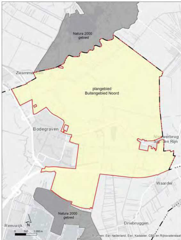
Figuur 1.2 Globale begrenzing bestemmingsplan Buitengebied Noord

Het bestemmingsplan Buitengebied West (figuur 1.3) ligt in het westelijke deel van de gemeente, globaal gelegen tussen de plaatsen Bodegraven en Reeuwijk dorp. De bebouwde kom maakt geen onderdeel uit van het bestemmingsplan. Dit bestemmingsplangebied grenst niet direct aan een Natura 2000-gebied.