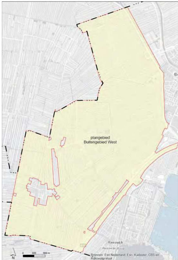
Figuur 1.3 Globale begrenzing plangebied bestemmingsplan Buitengebied West