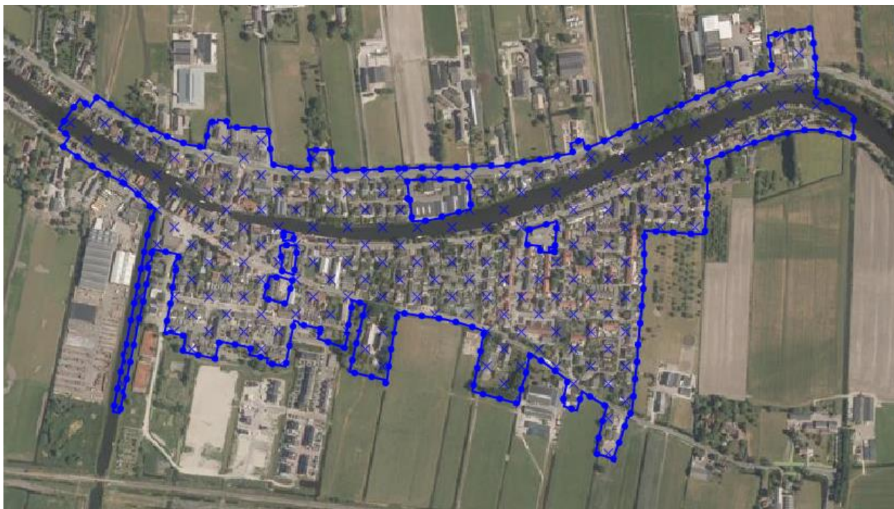
Figuur 1. Beheersverordening Kern Nieuwerbrug.

Het plangebied betreft het gehele gebied waarvoor de beheersverordening 'Kern Nieuwerbrug' van toepassing is (afbeelding 1).