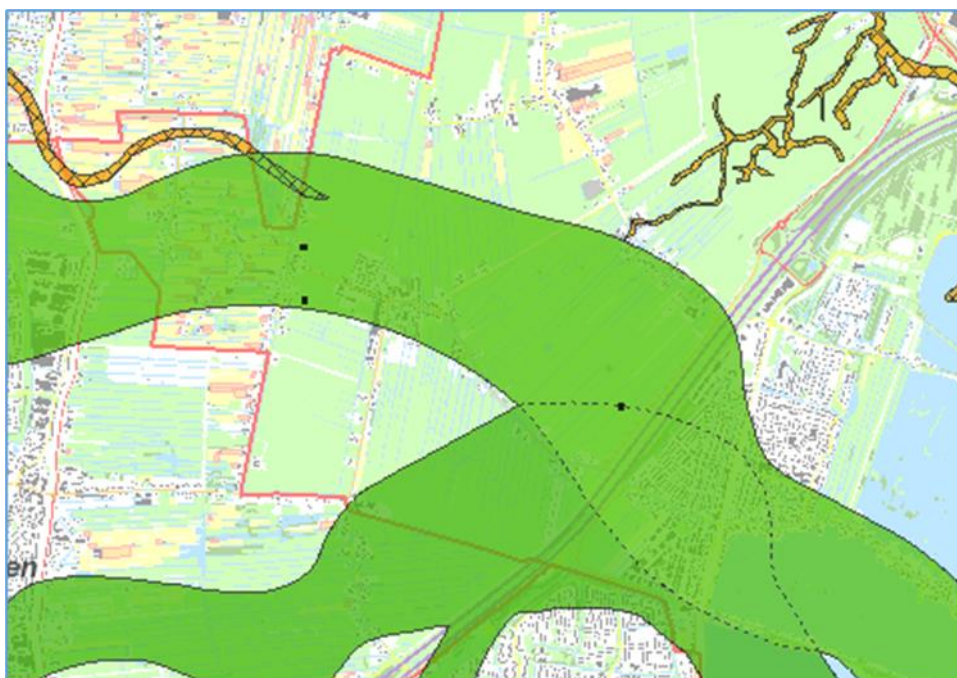
Figuur 3. Nieuwe situatie. De groene zones zijn de stroomgordels, waarvan de locaties zijn aangepast op basis van voortschrijdend inzicht.