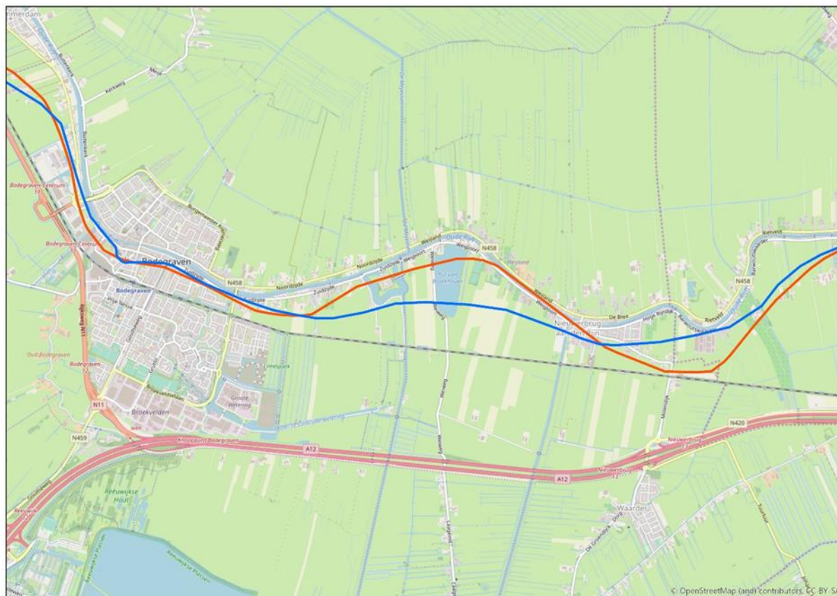
Figuur 4. De blauwe lijn geeft de Romeinse Limesweg weer zoals deze op de oude beleidskaart was aangegeven. De rode lijn is het tracé, zoals het is vastgesteld na uitgebreid archeologisch onderzoek.

Ook de Romeinse Limesweg is de afgelopen jaren nader onderzocht. Van het tracé tussen Bodegraven en Nieuwerbrug aan den Rijn is vast komen te staan dat deze een stuk noordelijker heeft gelegen dan eerder gedacht (zie figuur 4). De kaarten zijn hierop aangepast.