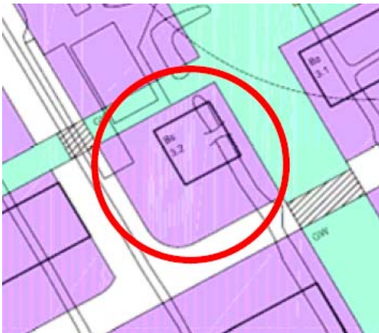
Figuur 1: Huidige bestemming

De gemeente Bodegraven-Reeuwijk heeft de Omgevingsdienst gevraagd een onderbouwing aan te leveren voor een aantal milieuaspecten voor de wijziging van het bouwvlak van Blok 7 op bedrijventerrein Rijnhoek ("partiële herziening Blok 7"). Het bouwvlak wordt vergroot van 400 m 2 naar 680 m 2 .