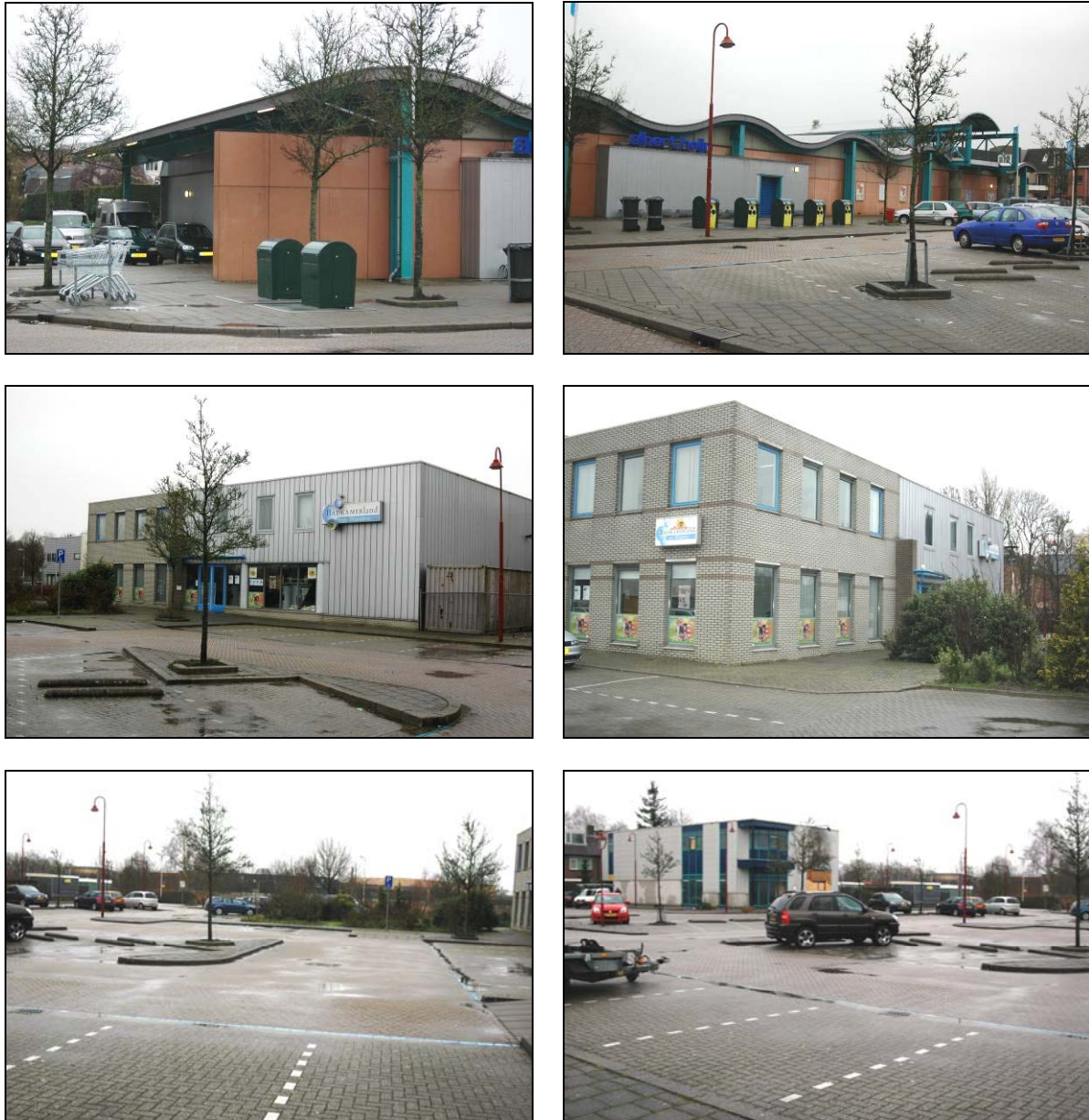
Figuur 3. Foto-impresie van de Albert Hein (foto's boven) en het plangebied van de Aldi-markt (foto's midden), alsmede een beeld van de openbare ruimte (foto's onder).

De openbare ruimte is grotendeels verhard en bezit een enkele kleine boom. Voor het gebouw van Badkamerland, waar de Aldi-markt is gepland, bevindt zich een kleine tuin met cultuurgroen.