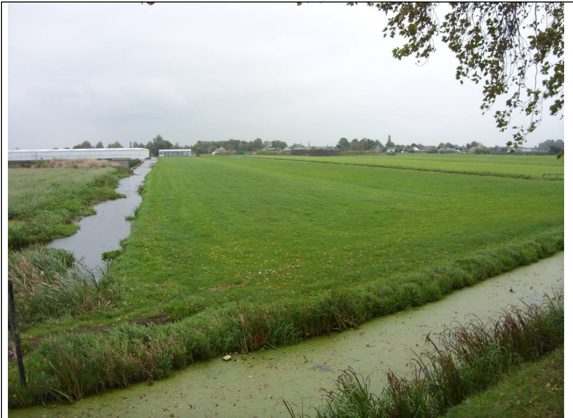
Plangebied vanaf de westkant. Links het bestaande bedrijf.