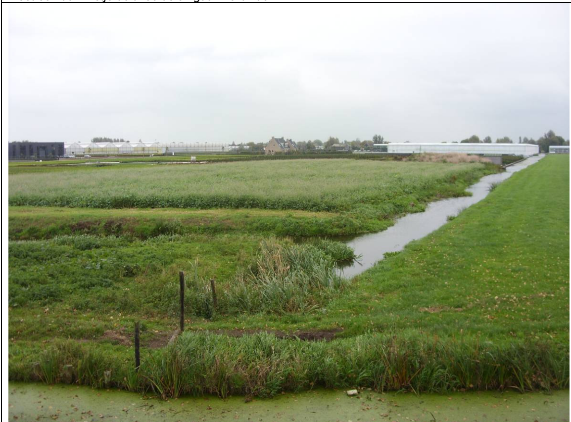
Zicht op het bestaande sierteeltbedrijf.