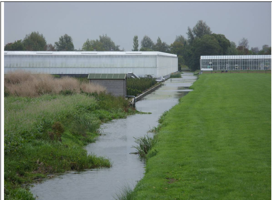
Links het bestaande bedrijf, rechts het voor sierteelt in te richten deel. Ter hoogte van het pomphuisje moet een dammetje de twee delen gaan verbinden.