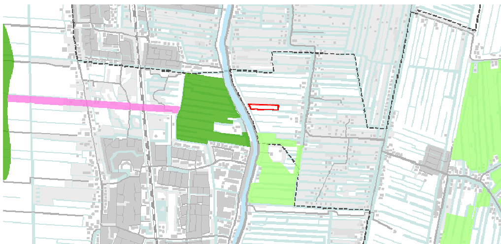
Figuur 4 Ligging van EHS in nabijheid. Roodomrand de uitbreiding. Donkergroen: bestaande natuur en prioritaire nieuwe natuur. Lichtgroen: overige nieuwe natuur. Paars: ecologische verbindingzone.

Het dichtstbijzijnde N2000 gebied is het Vogelrichtlijngebied Broekvelden, Vettenbroek & Polder Stein, gelegen op circa 5 km afstand. Gezien deze afstanden heeft onderhavige planontwikkeling geen effect op deze gebieden.